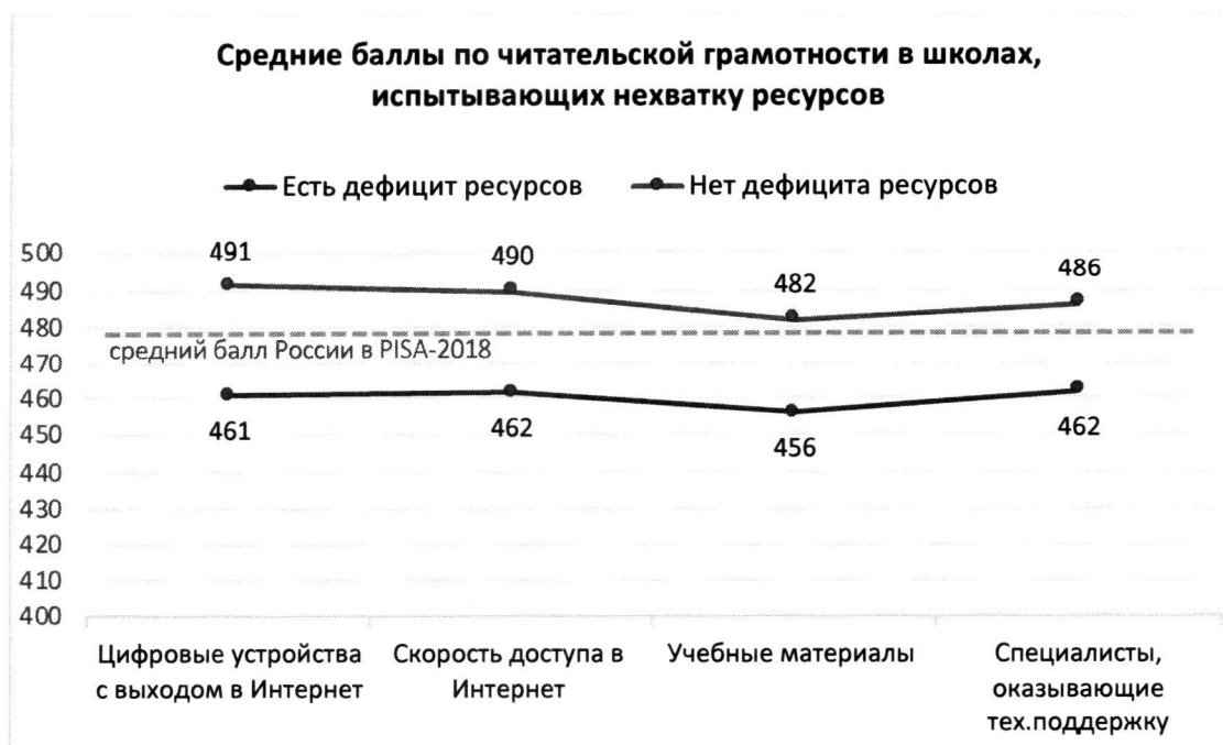
Рисунок 2. Дефициты ресурсов образовательной организации и результаты обучающихся по шкале читательской грамотности PISA относительно среднего результата РФ в PISA-2018

Дефициты ресурсов определялись на основании ответов администрации школ на вопросы анкеты и могут отражать субъективную точку зрения директора.